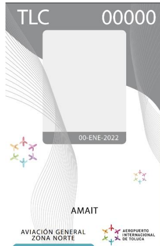
Gris: Aviación General Zona Norte